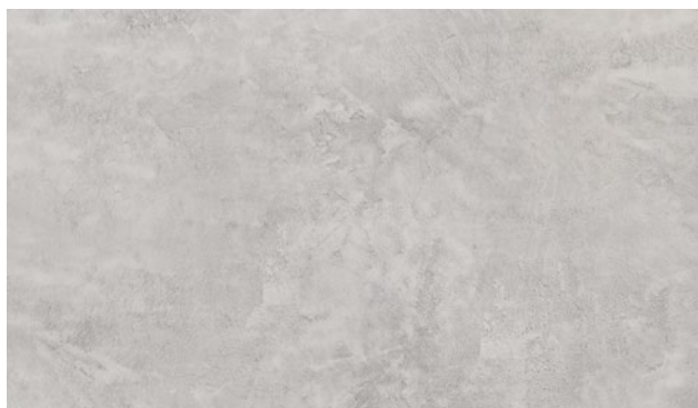
15470-1 | BETON SELENIT SELENITE CONCRETE