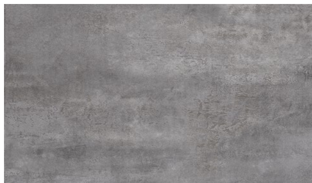
15410-2 | BŘIDLICE KOV SLATE METAL