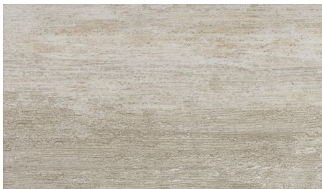
15415-1 | TRAVERTIN LIGHT TRAVERTINE LIGHT