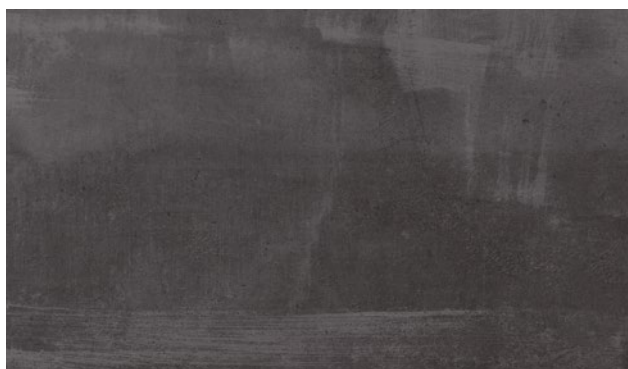
15539-54 | CEMENT METALIC METALLIC CEMENT