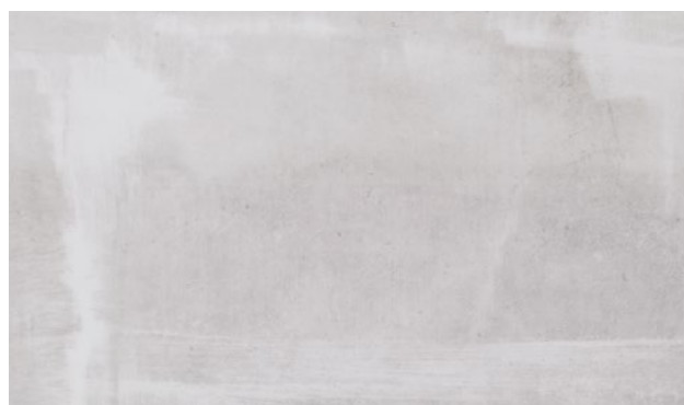
15539-51 | CEMENT BIANCO BIANCO CEMENT