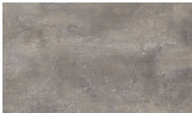
15470-2 | MRAMOR RUSTIC RUSTIC MARBLE