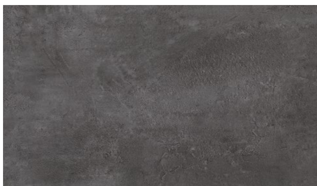
15470-58 | BETON ANTRACIT ANTHRACITE CONCRETE