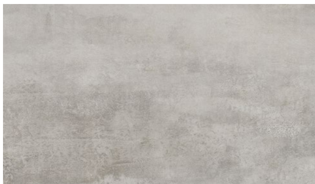
15410-1 | BŘIDLICE STŘÍBRNÁ SILVER SLATE