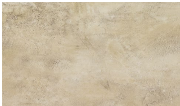
15470-3 | MRAMOR SAND MARBLE SAND