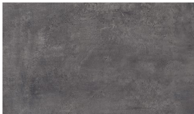
15470-57 | BETON GRAFIT GRAPHITE CONCRETE