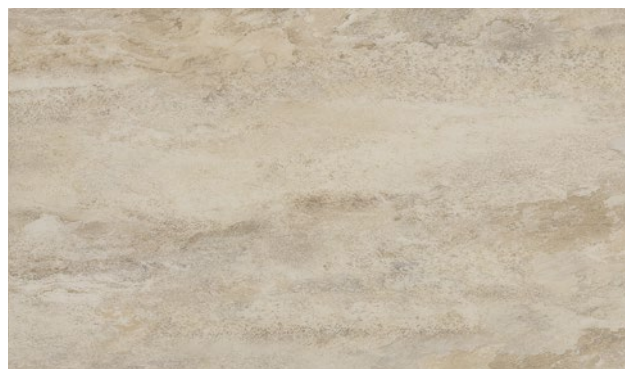
15417-1 | PÍSKOVEC IVORY SANDSTONE IVORY